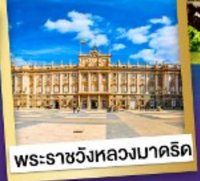
พระราชวังหลวงมาดริด