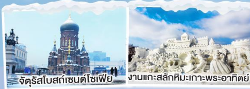
จัตุรัสโบสถ์เซนต์โซเฟีย