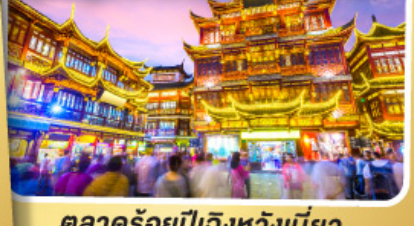
ตลาดร้อยปีเจียงหวงเมี่ยว

สนุกสุดมันส์ไปกับเครื่องเล่น Shanghai Disneyland เต็มวัน