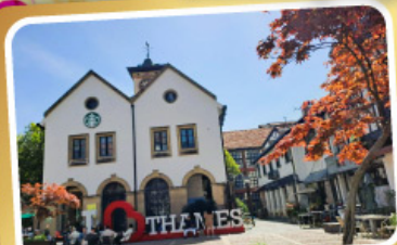
เทมส์ทาวน์