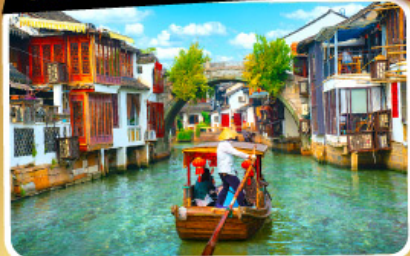
เมืองโบราณจูเจียเจียว