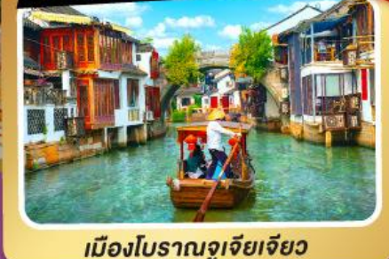
เมืองโบราณจู่เจียเจียว