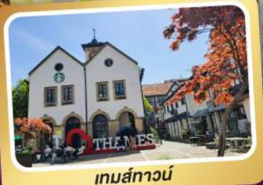
เทมส์ทาวน์