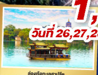
ล่องเรือทะเลสาปซีหู