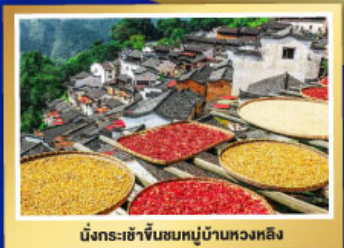
มัสการชาจีนชมหมู่บ้านทวงหลิง