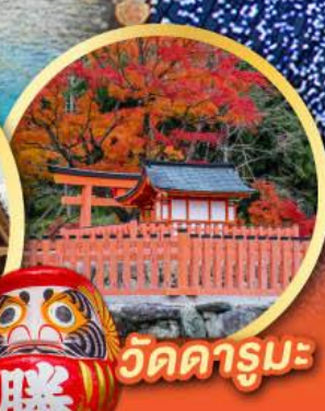
วัดคารุมะ