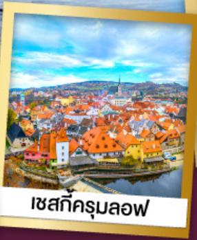
เซสกีครุมลอฟ