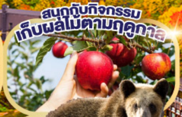
สนุกกับกิจกรรม เก็บผลไม้ตามฤดูกาล