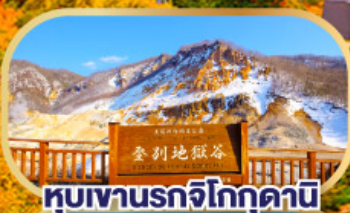
หุบเขานรกจิโกกุคาบิ

นั่งกระเช้าชมวิวฮาโกดาเตะ (รวมค่ากระเช้า)