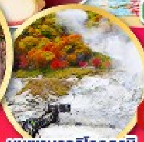
หุบเขานรกจิกุกุคาชิ