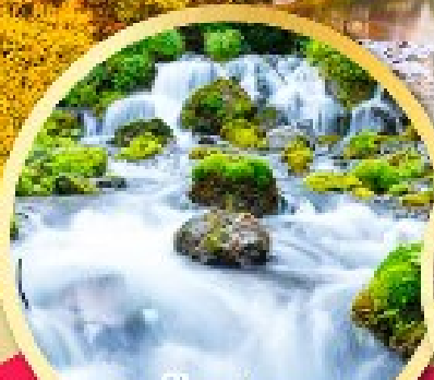
สันผืนน้ำแร่ธรรมชาติ ณ สวนฟูทาคาชิ