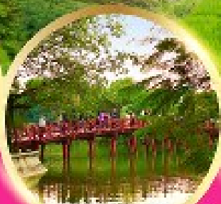
ทะเลสาบคินคาน