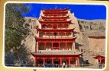
กำแพงสลักม่อเกา