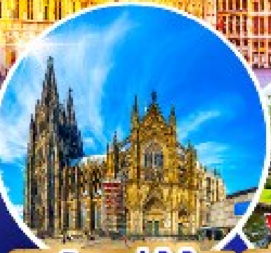
มหาวิหารแห่งโคโลญ