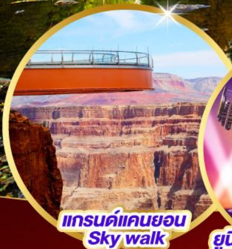
แกรนด์แคนยอน Sky walk