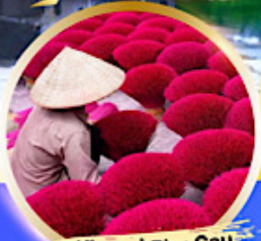
หมู่บ้านรูป Phu Cau