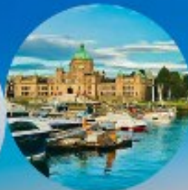
Victoria, British Columbia (Canada)