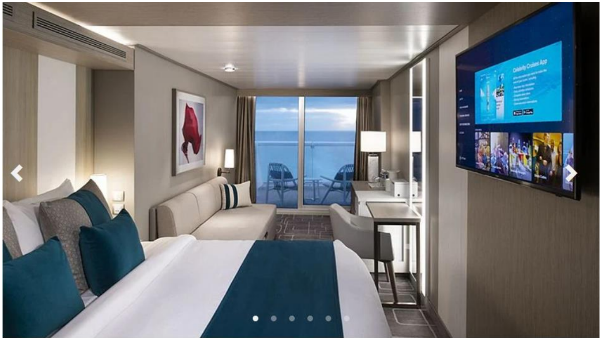
Edge Stateroom with Infinite Veranda