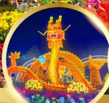
สะพานมังกรพันไฟ