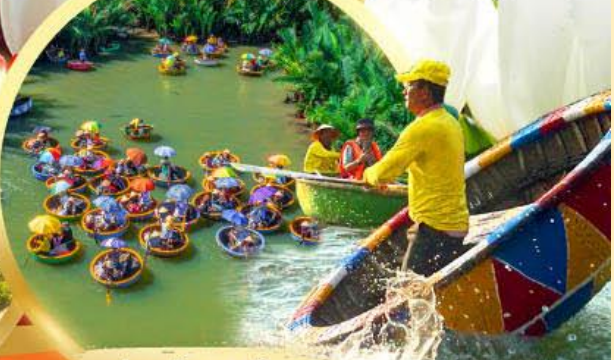
ล่องเรือกระด้ง