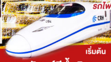
เริ่มต้น