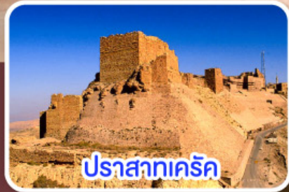
ปราสาทครีค