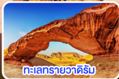
ทะเลทรายวาดีรัม