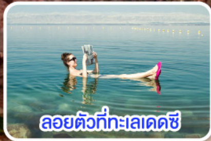
ลอยตัวที่ทะเลเดดซี