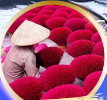
หมู่บ้านรูป Phu Cau