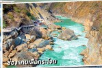
ช่องแคบเลือกระโจน