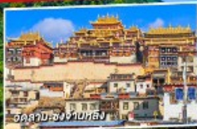
วัดลามะเซียงปาหลิง

แซงกรี่ล่า บินภายใน 1 เที่ยวบิน 5 วัน 4 คืน ไม่ลงร้านช้อปปิ้ง ไม่จ่ายออฟชั่น