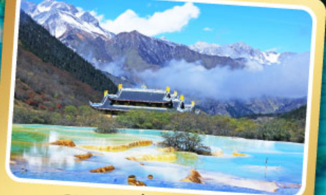
อุทยานแห่งชาติหลวงหลง