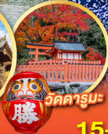
วัดดารุมะ