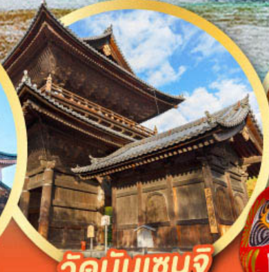
วัดนินเซนจิ