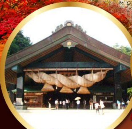
ศาลเจ้าอิชิโมะโทชะ