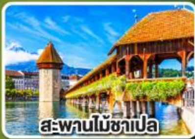
สะพานไม้ชาเปล