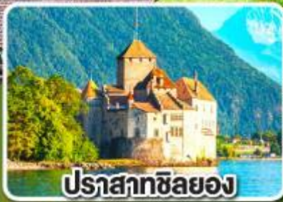
ปราสาทซิลยง