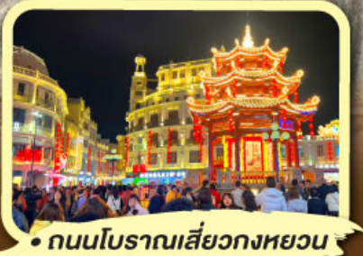
• ถนนโบราณเสี่ยวกงหยวน