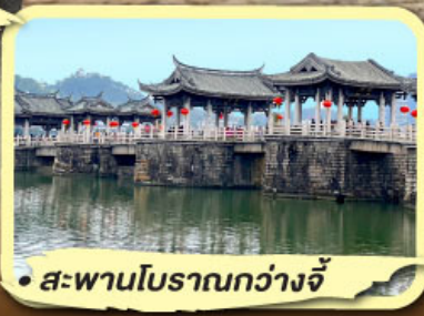
• สะพานโบราณกว้างจี้