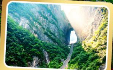
เวาเทียนเหมินซาน

ทริปเดียวเที่ยว 2 เมืองโบราณ ฝูหลงและเฟิ่งหวง ลัมรส สุกี้เห็ด บั๊อย่างเกาหลี เปิดปักษ์