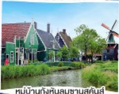
หมู่บ้านกังหันลมซานสคินส์