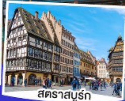
สตราสบูร์ก