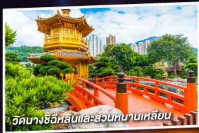
วัดนางชีอิหลินและสวนหนานเหลียน