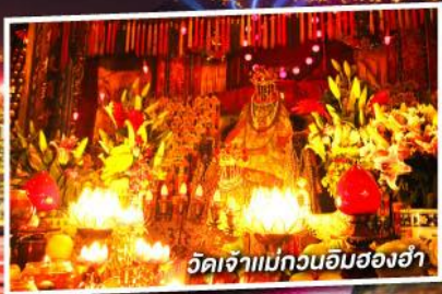
วัดเจ้าแม่กวนอิมฮ่องอ่ำ