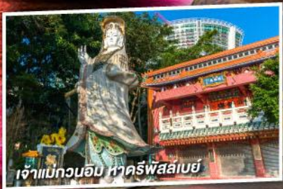
เจ้าแม่กวนอิม หาดรีพีส์เลย์