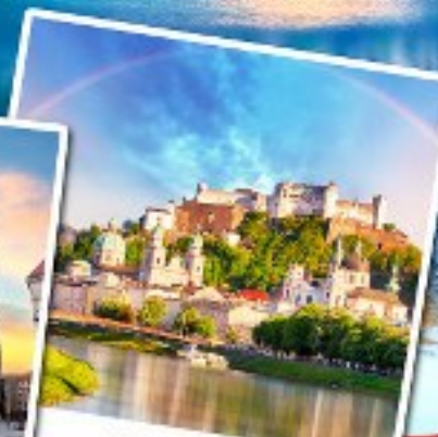
ชาลส์บวร์ก