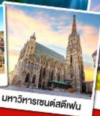
มหาวิหารเซนต์สตีเฟน