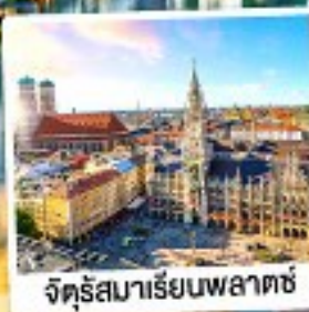
จัตุรัสมาเรียนพลาตซ์

28 เม.ย.-04 พ.ค. 67 01-07, 06-12, 08-14, 20-26 พ.ค. 67 29 พ.ค.-04 มิ.ย. / 05-11, 18-24 มิ.ย. 67 24-30 ก.ค. 67