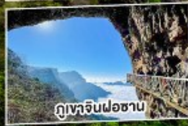
ภูเขาจินฝอซาน