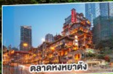
ตลาดหงหยาดัง