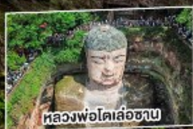
หลวงพ่อดิล่อซาน