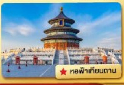
★ หอฟ้าเทียนถาน