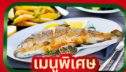
เมนูพิเศษ ปลาเทราต์ย่าง