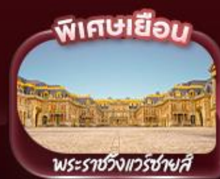
พิศขะเยื้อน