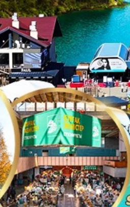
ตลาดกรีนบาร์ชา