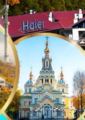
โบสถ์เซนต์คอฟ