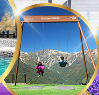
ชิงช้า Yoo hoo! Swing