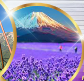
โออิชิ ปาร์ค