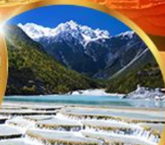
หุบเขาพระจันทร์ สีน้ำเงิน