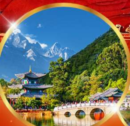
สระมิงกรดำ