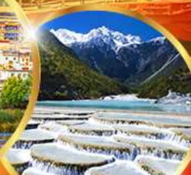
หุบเขาพระจันทร์ สีน้ำเงิน