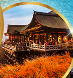
วัดคิโยมิสึ