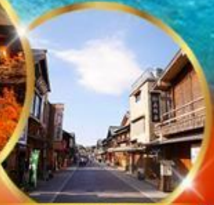
ถนนคนเดินฮิสะ