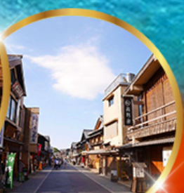
ถนนคนเดินโอเสะ