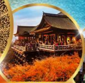
วัดคิโยมิสึ