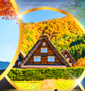
ชิราคาวาโกะ