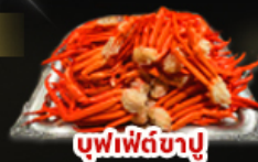
บุฟเฟ่ต์ขาปู

พักทาคายาม่า 1 คืน | พักนาโงย่า 1 คืน พักฟูจิ 1 คืน | ออมเซ็น 2 คืน