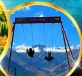
Yoo hoo! Swing