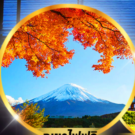
ภูเขาไฟฟูจิ