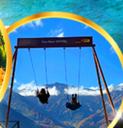
Yoo hoo! Swing