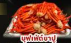
บุฟเฟ่ต์ซาซุ

พิททาคายาน่า 1 คิม | พิกนาคิย่า 1 คิม พิทฟูจิ 1 คิม | ออนเซ็น 2 คิม