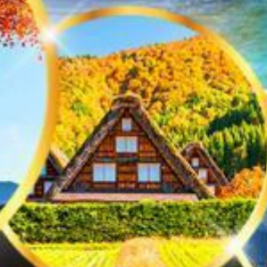
ชิราคาวาโกะ