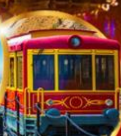
รถรางซาปา