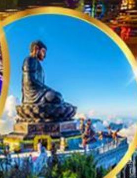
ฟานซีปัน