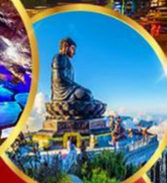
ฟานซีปัน