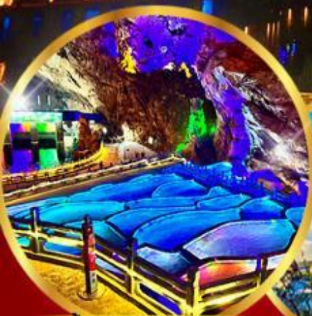
ถ้ำกนางแอน