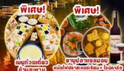
เมนูถ้วยเต๋อชว ยำสะพาน