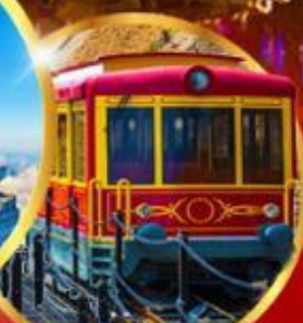
รถรางซาปา