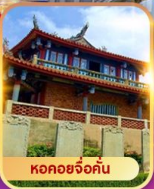
หอคอยจ้อคั่น