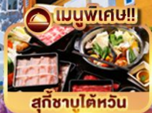
เมนูพิเศษ!! สุก๊ชาบูได้หวัน