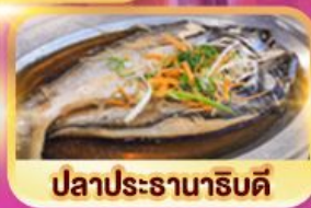
ปลาประรานาธิบดี