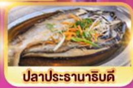
ปลาประธารานริบตี