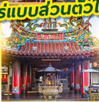
ศาลเจ้าจื่อหนานกง