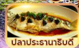
ปลาประจําถิ่น