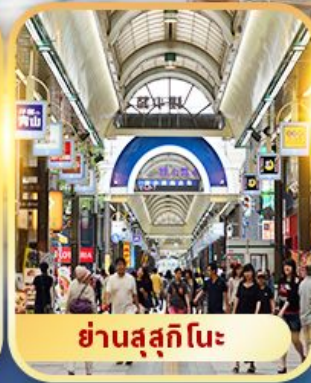
ย่านสุสุกิโนะ