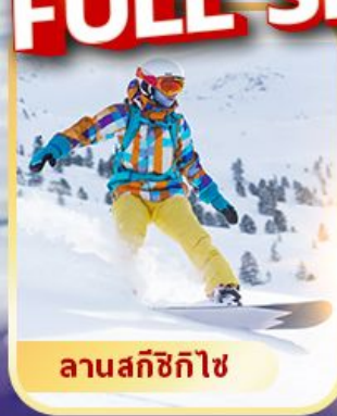
ลานสกีชิโกไซ