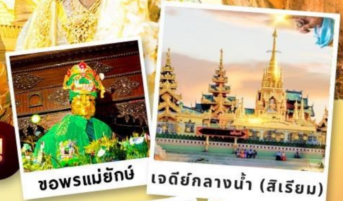
ขอพรแม่ยักษ์