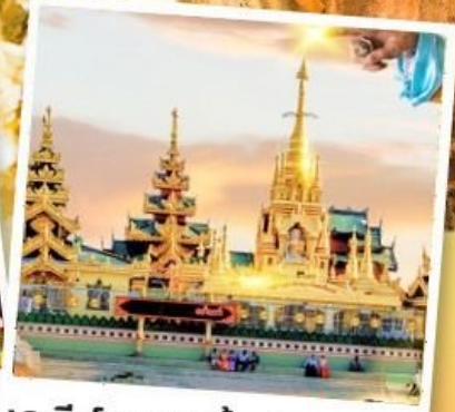
เจดีย์กลางน้ำ (สิริเรียม)