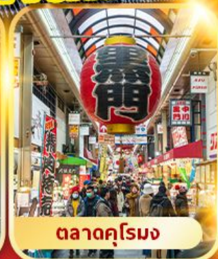
ตลาดคุโรมง