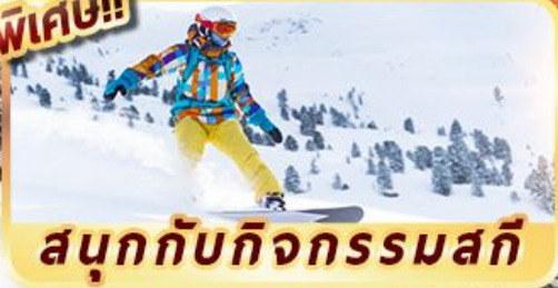
สนุกกับกิจกรรมสกี