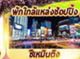
พักใกล้แหล่งช้อปปิ้ง