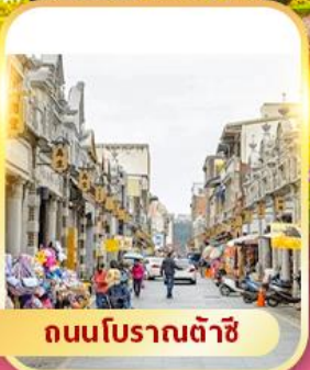
ถนนโบราณต้าชี่