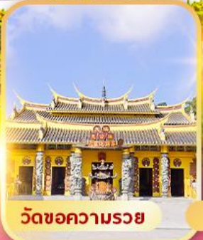
วัดขอความรอย