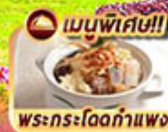
พระกระโดดกำแพง