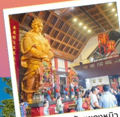
วัดเขangkงหมิว