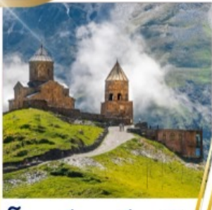
โบสถ์เกอร์เกติ