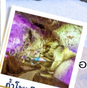
ถ้ำไฟรมีเทียส