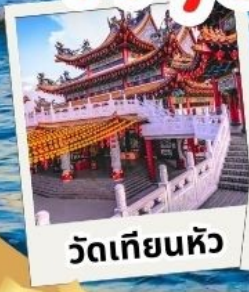
วัดเทียนฮิว