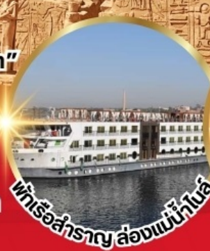
แพเรือสำราญ ล่องแม่น้ำไนล์

*เงื่อนไขเป็นไปตามที่บริษัทกำหนดเท่านั้น*