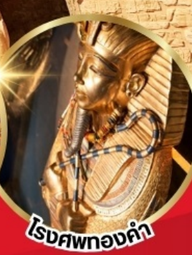
โรงศพทองคำ

บินภายใน 2 เที่ยวบิน จาก CAI - ASW // LXR - CAI